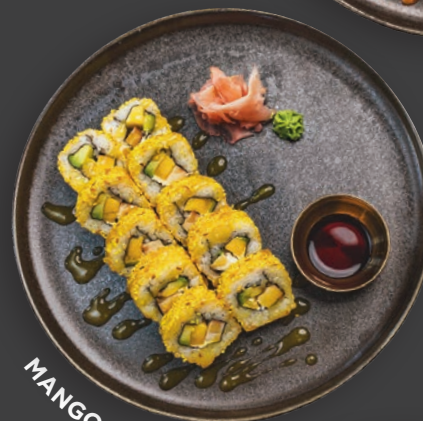
MANGO & TOFU

Tofu, Mango, Avocado, Frischkäse, Kurkuma-Sesam und Mango Sauce