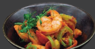
GAMBAS AL AJILLO