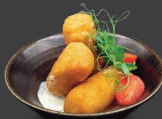
CROQUETAS DE JAMÓN