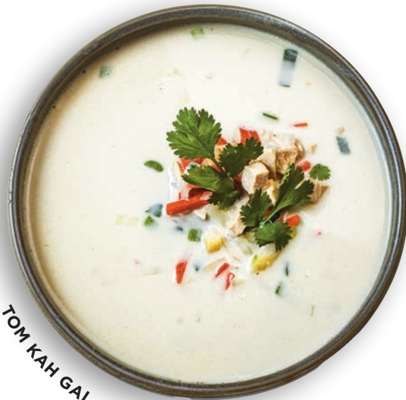
TOM KAH GAI