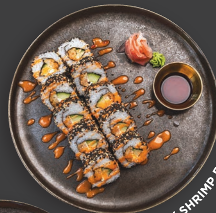
CRISPY SHRIMP ROLL

Shrimp Tempura, Gurke, Frischkäse, heller und schwarzer Sesam und Bang Bang Sauce