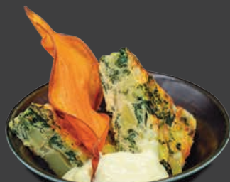
TORTILLA DE QUESO