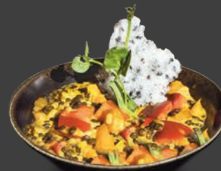
LINSEN KOKOS CURRY